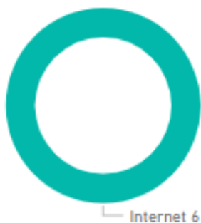
Gráfico 2. Por canal de entrada

Dentre os canais de atendimento, todos os registros foram realizados pela internet e o modo de resposta escolhido pelo cidadão também foi a internet.